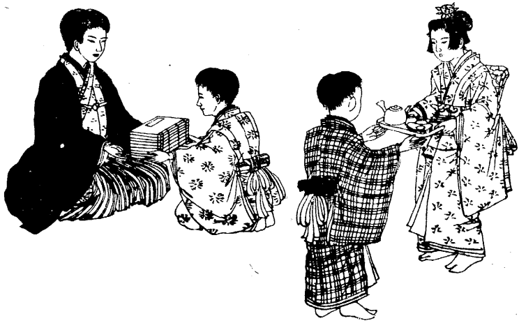
人に物をわたす圖