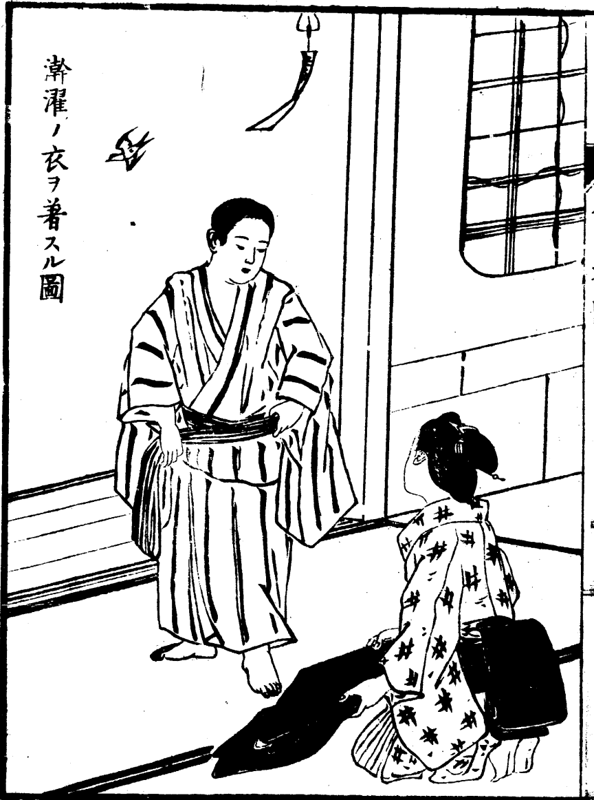
洗濯ノ夜ヲ著スル圖