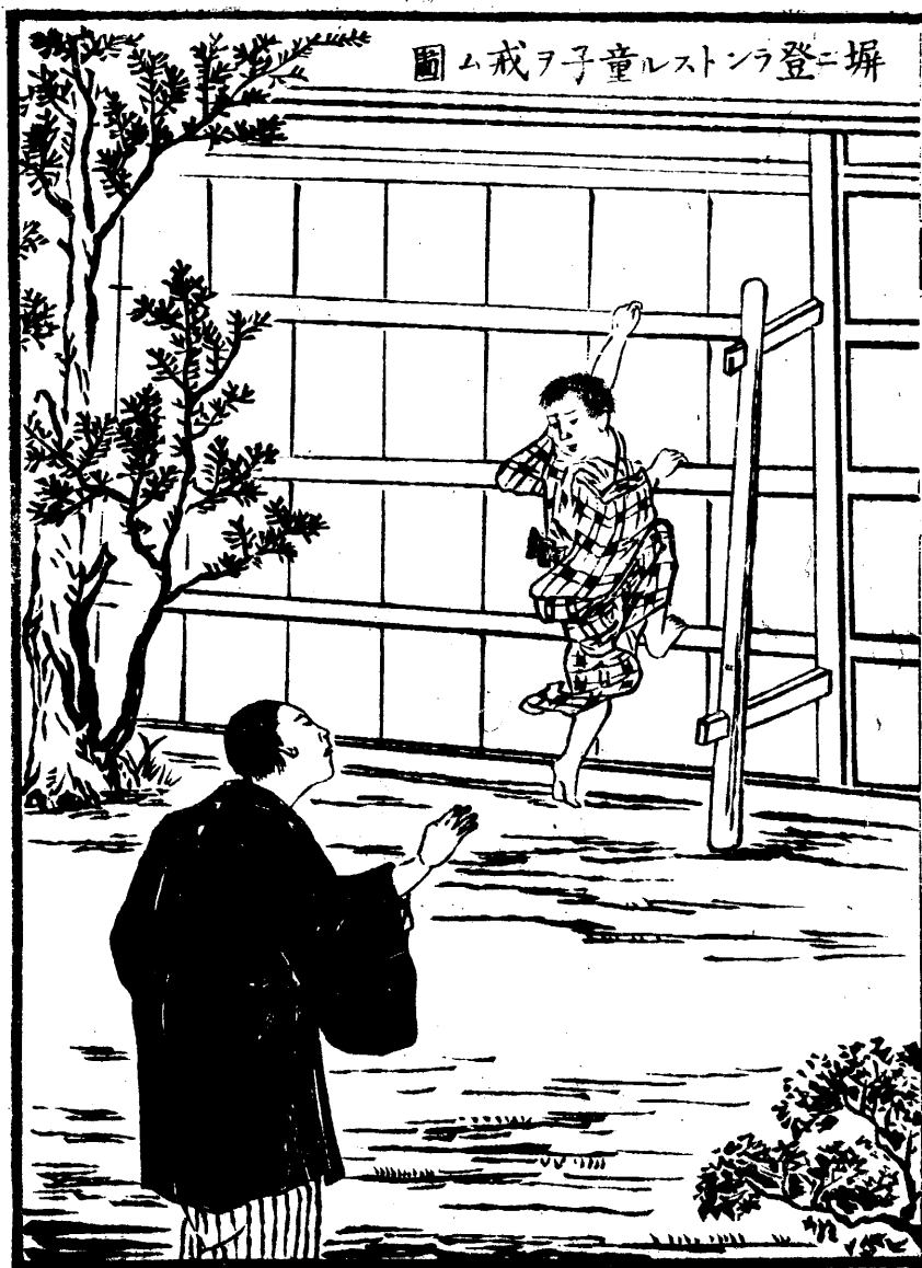
塀に登ラスト童子ヲ戒ム圖