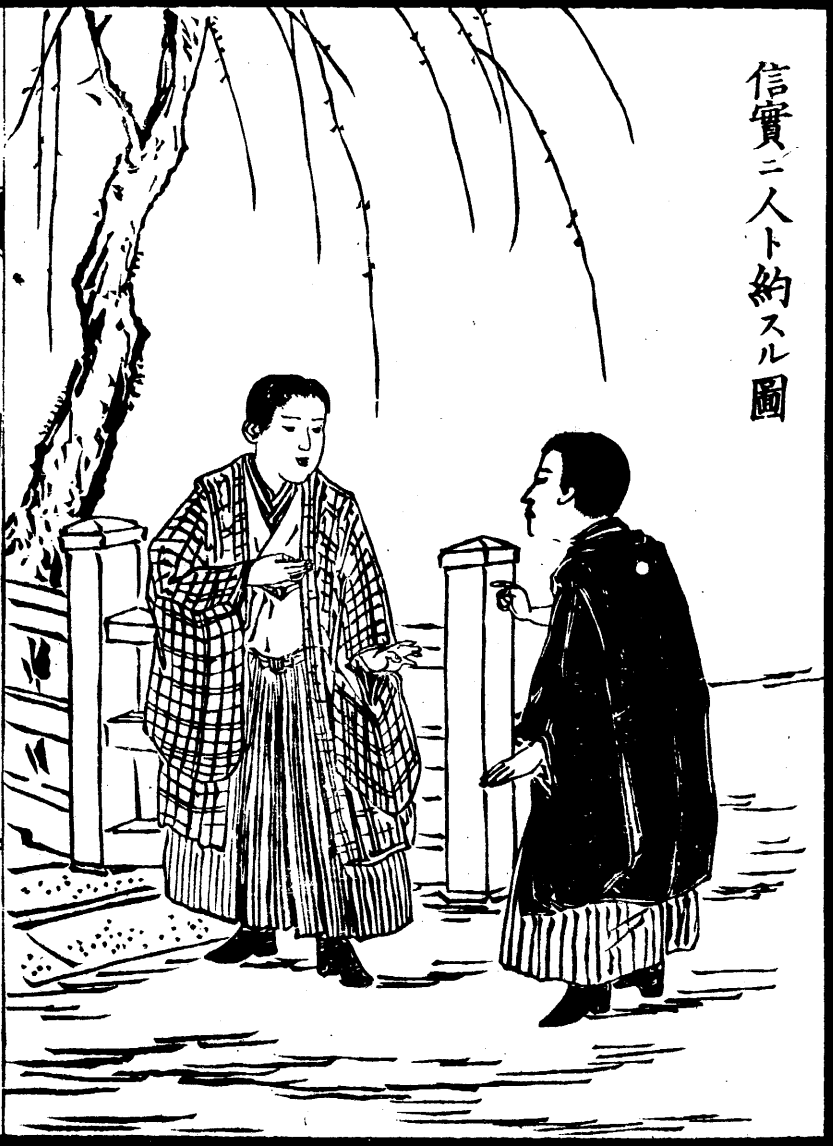
信實二人ト約スル圖

○しよくもつをみだりに こふことをなかれ ○しよくもつをすぐせば からだにがいあり ○ほういうにまどはるは しんとつをもちとす ○たはむれにもいつはり