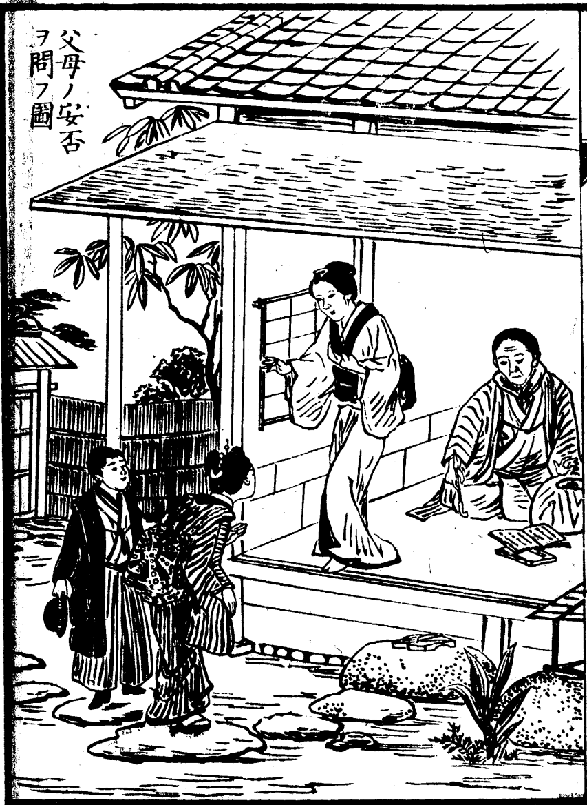
父母ノ安否 ヲ問フ圖