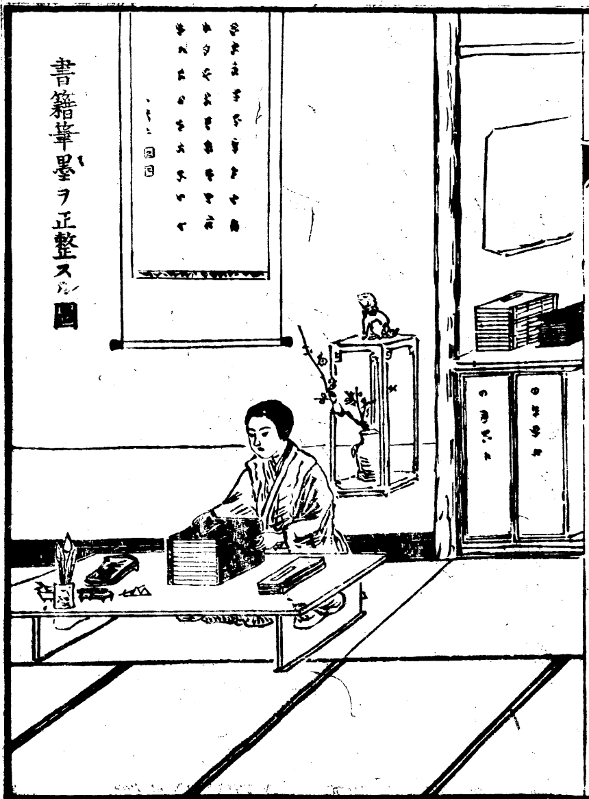
書籍筆墨ヲ正整スル圖