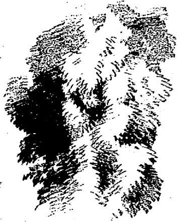
圖 一 第