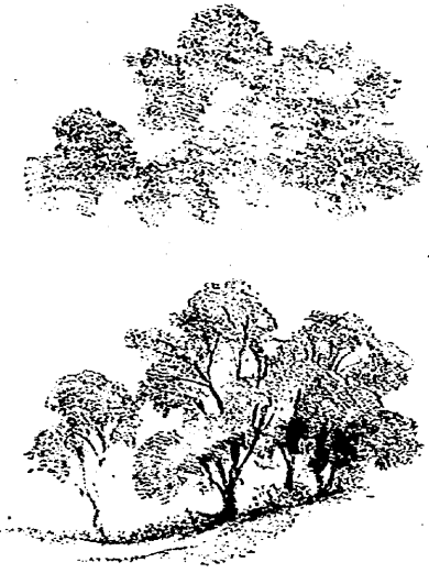
圖 三 第