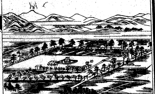
神戶村櫻神社ノ圖

奥津川ハ、郡北ノ山溪間ニ發源シ、上齊原、下齊原、張藤、奥津川西等ノ諸村ノ間ヲ南流シ、西北ノ溪流ヲ合テ、至孝野、井坂ノ二村ヲ過キテ、稍東南ニ環リ、女原村ニ至リ、轉シテ西南ニ折レ、屈曲縈回シテ、再ヒ東南ニ向ヒ、又田川、院庄川等ノ名アリテ、津山川トナル、之ヲ郡中ノ巨川トス、此川、奥津川西村ヨリ女原村ノ間ハ、特ニ急流激湍ニテ、或ハ洲トナリ、或ハ瀧トナル、長洲、鮎回瀧等ノ稱ヘ