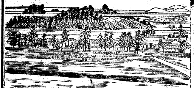
津山市中東南部ノ圖

餘ノ人 郡中西南ノ地ハ、田園稍 闊ケテ山少ナリ 津山ハ、津山川ニ沿ヒテ 三等國道ノ衝ニ當リ、國 ノ中央部ニ位シテ、市井 頗ル繁盛ナリ、戸數四千 二百四十、人口一萬四千 百八十餘アリ、 津山ノ北、西一ノ宮村ニ